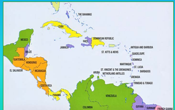
Carte montrant la zone de coopération de l'AEC, définie comme la Grande Caraïbe