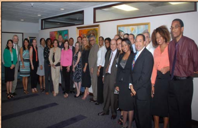
XXIV CSTD Réunion Port d'Espagne, Trinité-et-Tobago

La XXIVème Réunion du Comité Spécial de sur le Tourisme Durable (CSTD-24) s'est tenue au Siège de l'AEC, Port d'Espagne, Trinité-et-Tobago, les 16 et 17 juillet 2013.