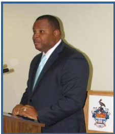
Hon. Christopher Sinckler, MP Ministro de Relaciones Exteriores y Comercio Exterior de Barbados (encargado)