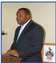
Hon Christopher Sinckler Ministre (a.i.) des Affaires étrangères et du Commerce extérieur de la Barbade